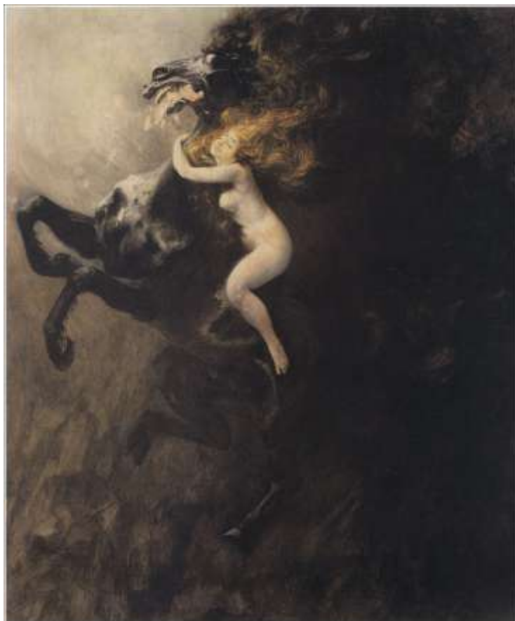
"Szał uniesień" - Władysław Podkowiński