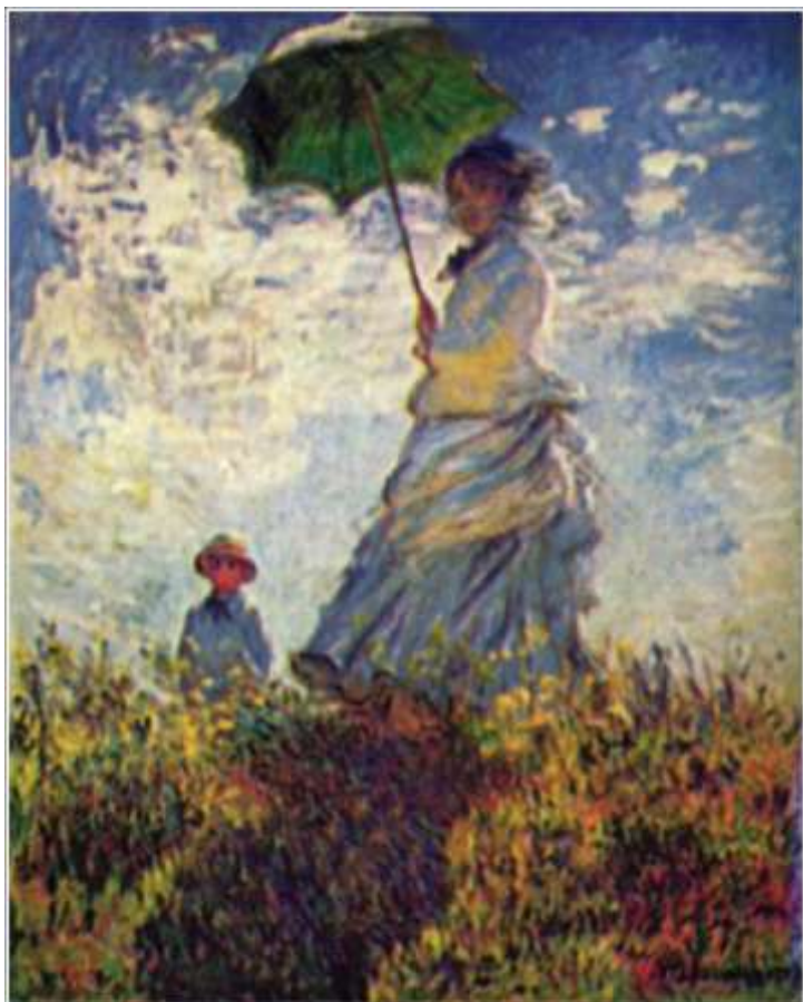
"Dama z parasolką" - Claude Monet