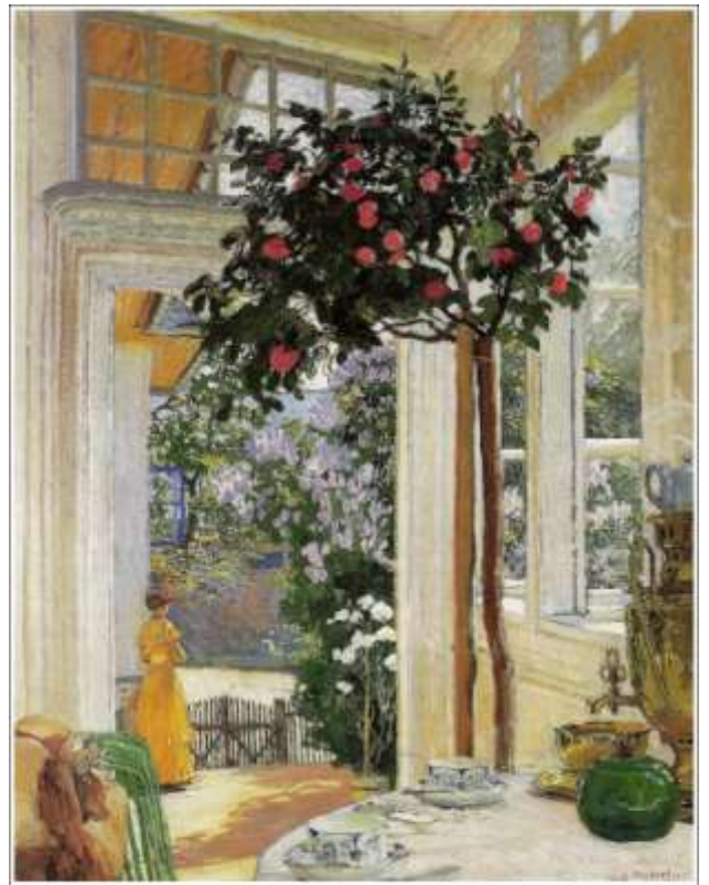
"Słońce majowe" - Józef Mehoffer