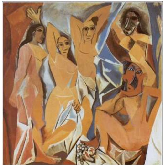
"Panny z Avignon" - Pablo Picasso