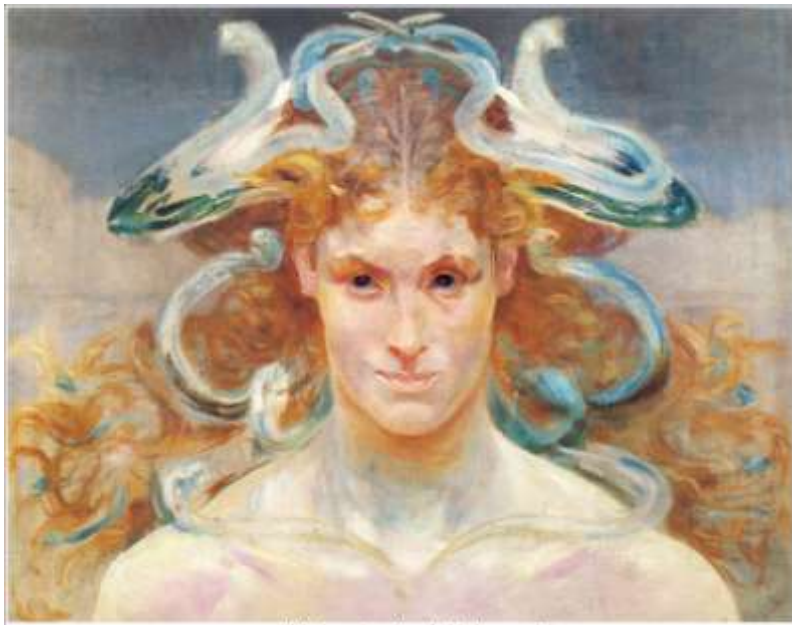
"Medusa" - Jacek Malczewski