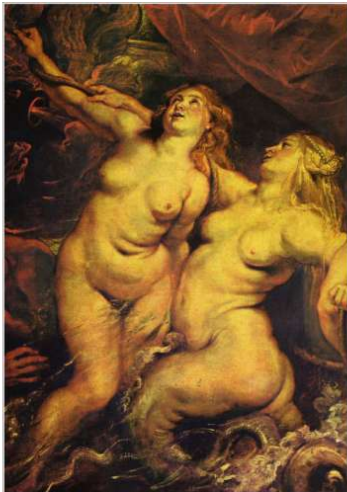
"Obfitość" - Peter Paul Rubens