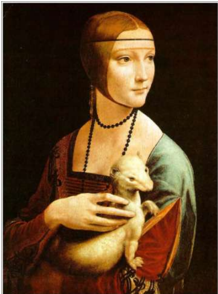
"Dama z łasiczką" - Leonardo da Vinci